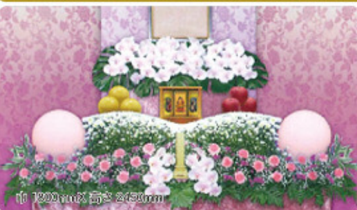
巾 1200mm 高さ 2450mm