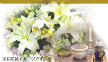
※お花はイメージです