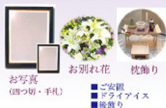
お写真 (四つ切・手札)